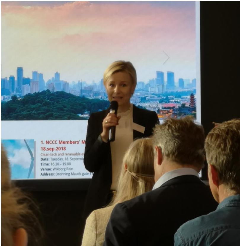
Arrangementet China - a cleantech superpower ble gjennomført hos Wikborg Rein